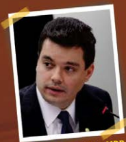
DEP. WALTER ALVES - MDB