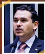
DEP. BETO ROSADO - PP