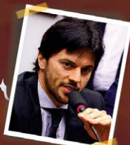
DEP. FÁBIO FÁRIA - PSD