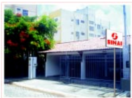
Frente da nova sede

casa para sua sede em Mossoró. O endereço é: Rua Luiz Ludugero, nº 26, Abolição II. A inauguração da sede de Mossoró ocorrerá tão logo a Regional faça a mudança.