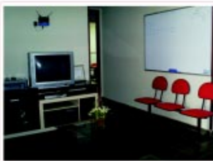
Sala de TV e vídeo