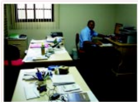
Secretaria e Tesouraria