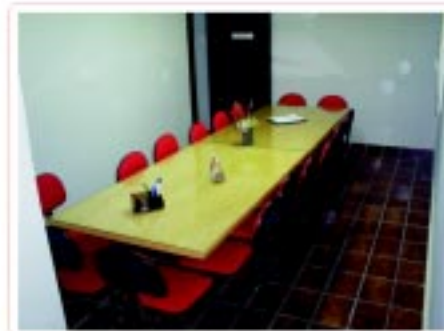
Sala de reunião