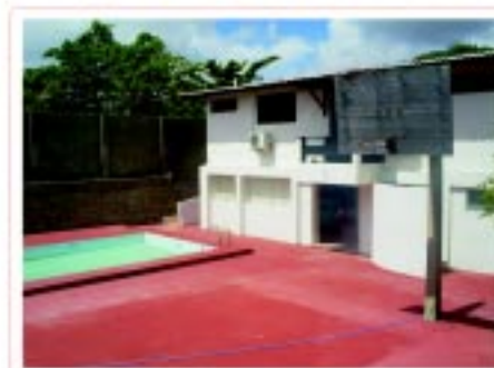
Espaço para o lazer