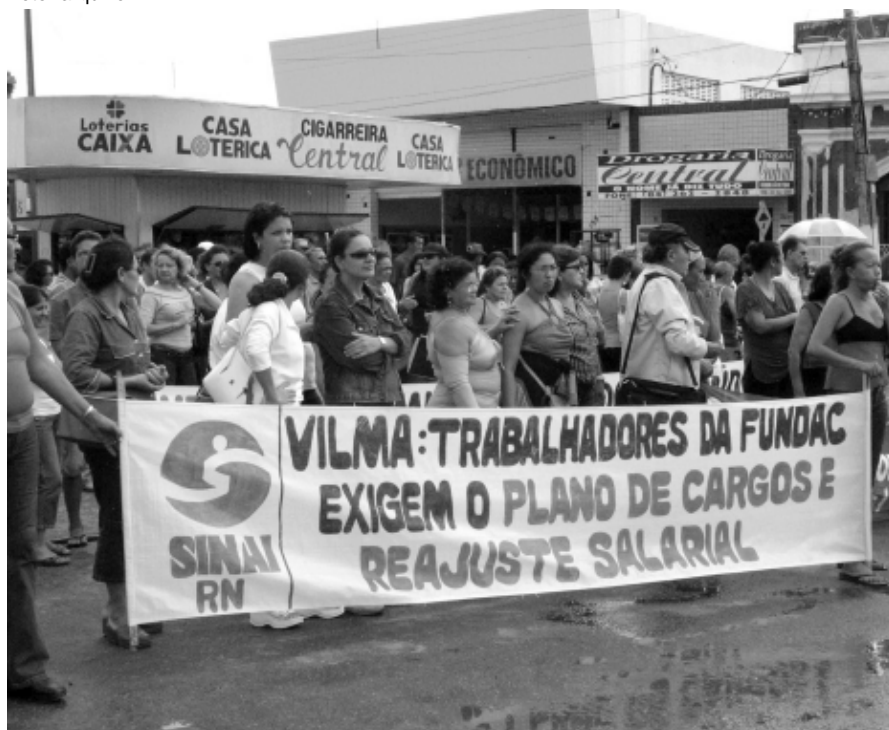
Atto público da categoria no interior do estado.

Para nós do SINAI, nada justifica a negligência do Governo do Estado. Nem mesmo um certo empenho da gestão anterior (encerrada no dia 31 de dezembro) das direções da FUNDAC e do IPERN garantiu a viabilização dos planos de carreiras. A resposta dos servidores do estado a negligência do governo virá com a luta e mobilizações a partir da assembléia do dia 7 de fevereiro.